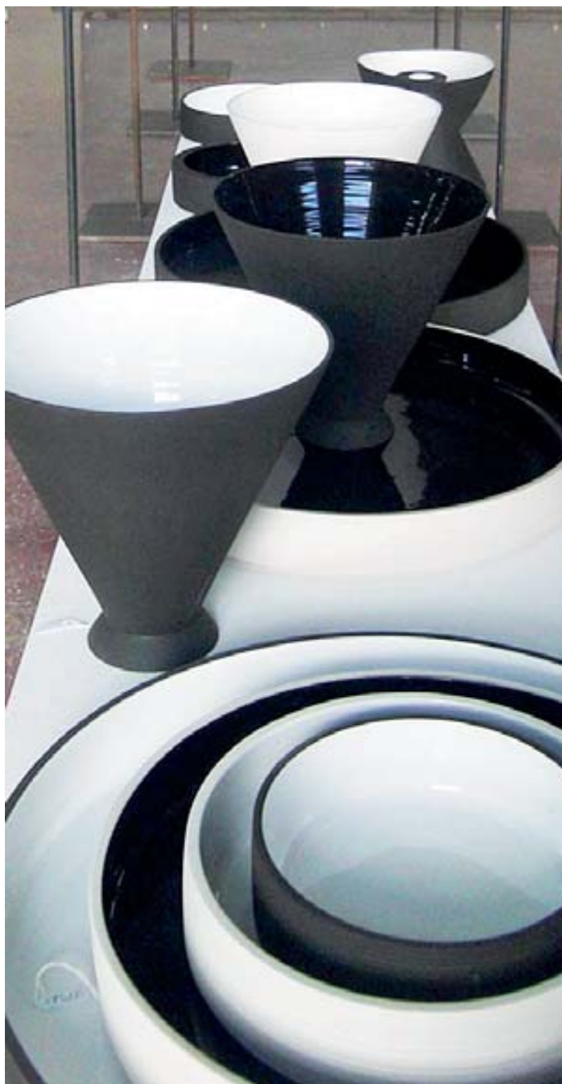
La mostra di Terrapintada